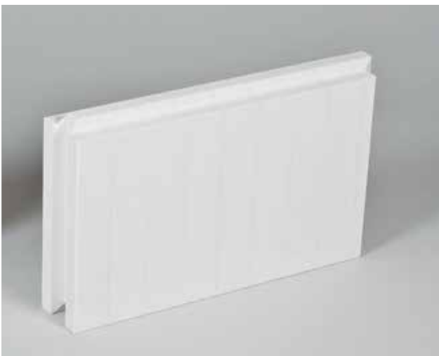
ACS ALTRA® COMPOSITE SYSTEM Formteile